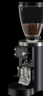
E65W GbS Weight-Based