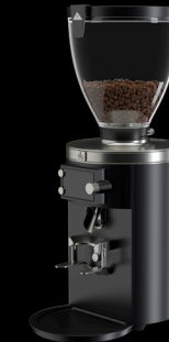
E80T GbS* Time-Based