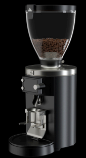
E80W GbS Weight-Based